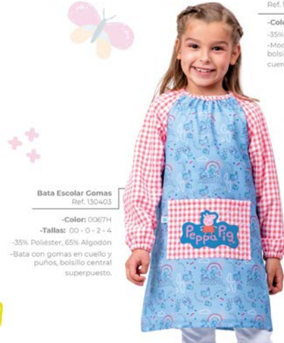
Bata Escolar Gomas Ref. 130403