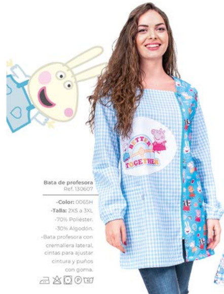
Bata de profesora Ref. 130607