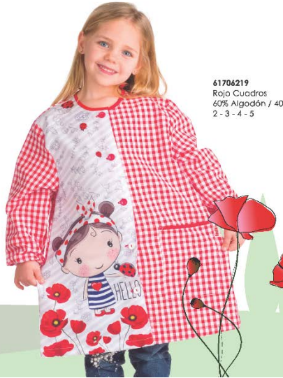
61706219 Rojo Cuadros 60% Algodón / 40% Poliéster 2 - 3 - 4 - 5