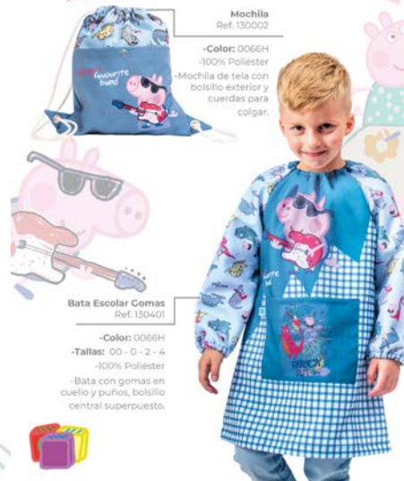
Bata Escolar Gomas Ref. 130401