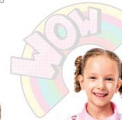
Mochila Ref. 130010