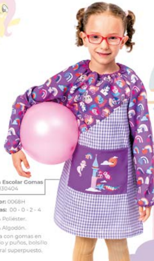
Bata Escolar Gomas Ref. 130404

-Color: 0068H -Tallas: 00 - 0 - 2 - 4 -70% Poliéster. -30% Algodón. -Bata con gomas en cuello y puños, bolsillo central superpuesto.