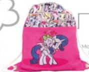
Mochila Ref. 130008

-Color: 0069H -65% Poliéster. -35% Algodón. -Mochila de tela con bolsillo exterior y cuerdas para colgar.