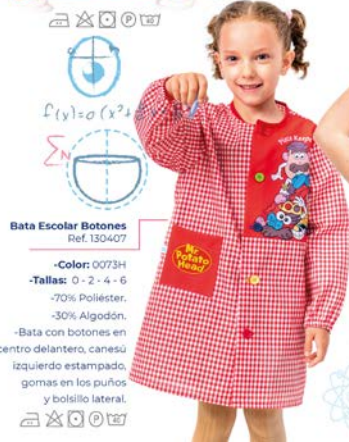
Bata Escolar Botones Ref. 130407

-Color: 0073H -70% Poliéster. -30% Algodón. -Mochila de tela con bolsillo exterior y cuerdas para colgar.