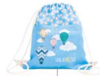
Mochila Ref. 130006

-Color: 4003 -Talla: Única -100% Poliéster. -Casula de profesora con cintas para ajustar cintura y bolsillo interior.