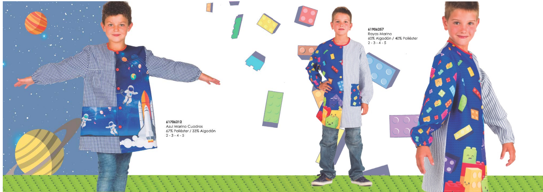
61704212 Azul Marino Cuadros 67% Poliéster / 33% Algodón 2 - 3 - 4 - 5