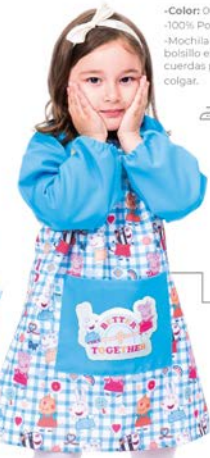
Bata Escolar Gomas Ref. 130402