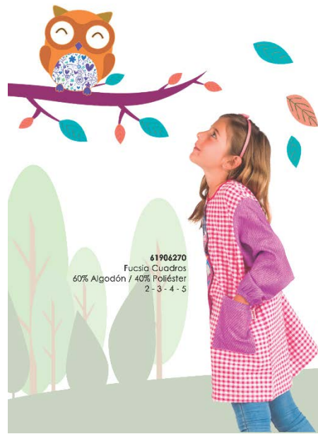
61906270 Fucsia Cuadros 60% Algodón / 40% Poliéster 2 - 3 - 4 - 5