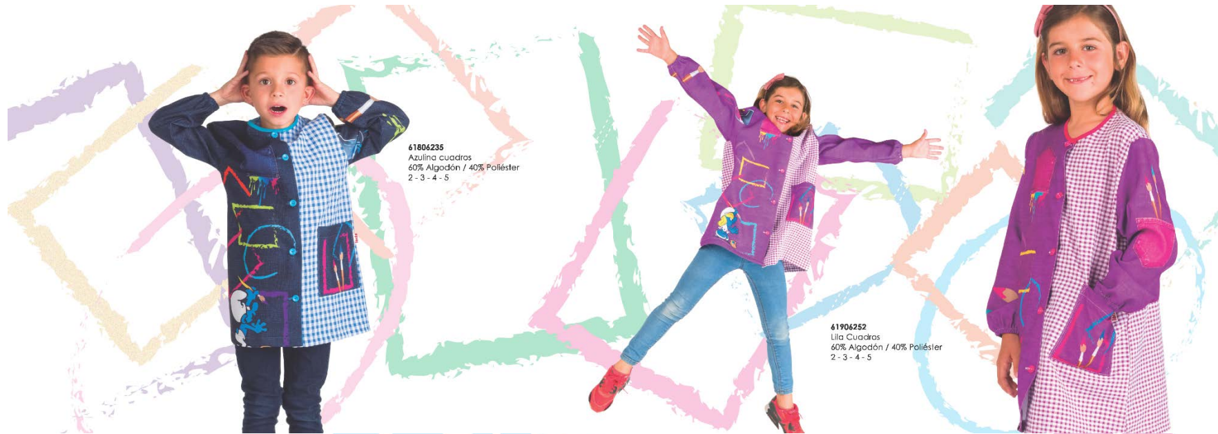
61806235 Azulina cuadros 60% Algodón / 40% Poliéster 2 - 3 - 4 - 5