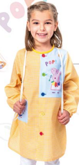
Bata Escolar Botones Ref. 130408