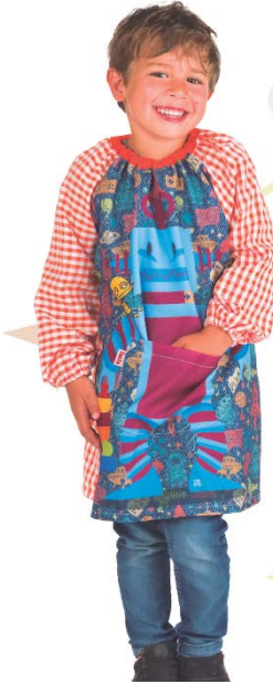
61906254 Naranja Cuadros 60% Algodón / 40% Poliéster 0 - 1 - 2 - 3