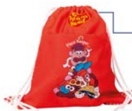
Mochila Ref. 130011

-Color: 0073H -70% Poliéster. -30% Algodón. -Mochila de tela con bolsillo exterior y cuerdas para colgar.