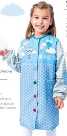
Bata Escolar Botones Ref. 130409

-Color: 4003 -100% Poliéster. -Mochila de tela con bolsillo exterior y cuerdas para colgar.