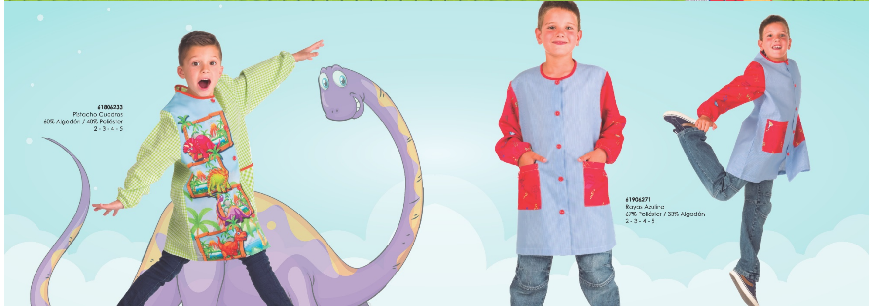
61804233 Pistacho Cuadros 60% Algodón / 40% Poliéster 2 - 3 - 4 - 5