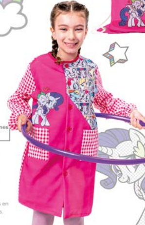
Bata Escolar Botones Ref. 130405

-Color: 0069H -65% Poliéster. -35% Algodón. -Mochila de tela con bolsillo exterior y cuerdas para colgar.