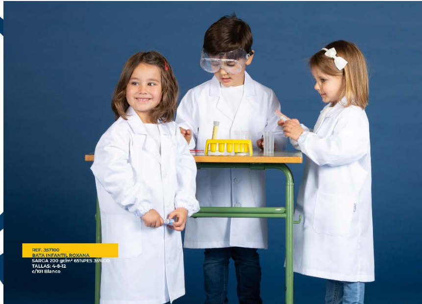
REF. 357100 BATA INFANTIL ROYANA SARGA 200 gr/m 2 65% PES 35% ALG TALLAS: 4-8-12 c/101 Blanco