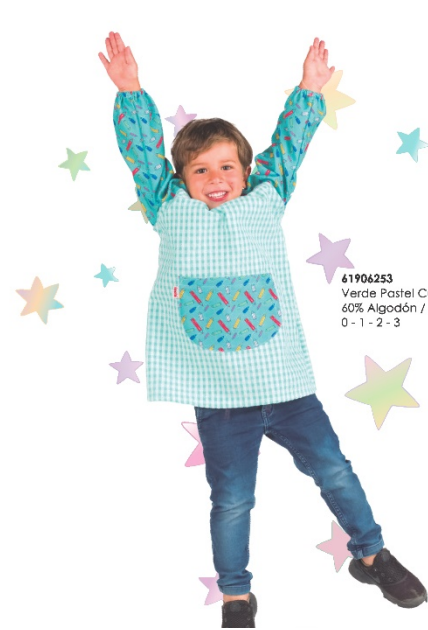
61906253 Verde Pastel Cuadros 60% Algodón / 40% Poliéster 0 - 1 - 2 - 3