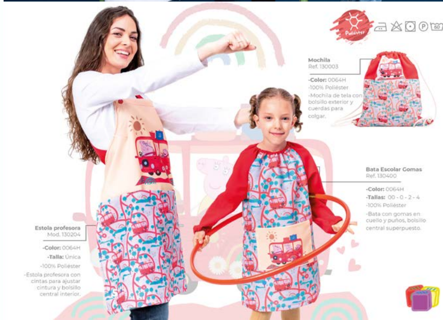
Estola profesora Mod. 130204 -Color: 0064H -Talla: Única -100% Poliéster -Estola profesora con cintas para ajustar cintura y bolsillo central interior.