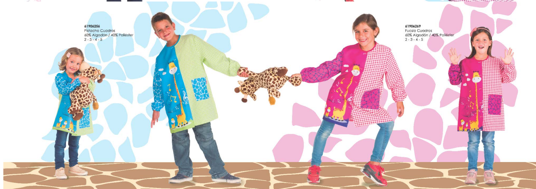
61906256 Pistacho Cuadros 60% Algodón / 40% Poliéster 2 - 3 - 4 - 5