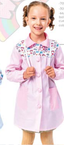
Bata Escolar Botones Ref. 130410