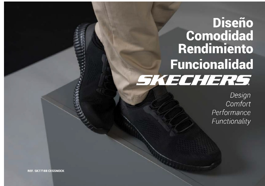
REF. SK77188 CESSNOCK

STANDARD: EN ISO 20347: 2012 / CATEGORY: OB FO SRC / SIZES: 39-38-5-40-41-42-43-44-45-46-47-5-48-5