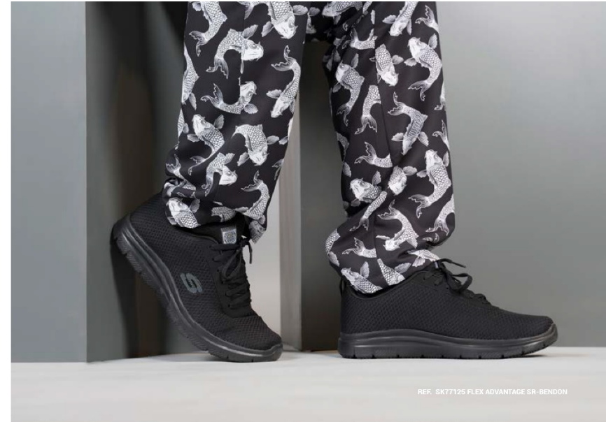
REF. SK77125 FLEX ADVANTAGE SR-BENDON

STANDARD: EN ISO 20347: 2012 / CATEGORY: OB SRC SIZES: 35-36-37-38-39-40-41