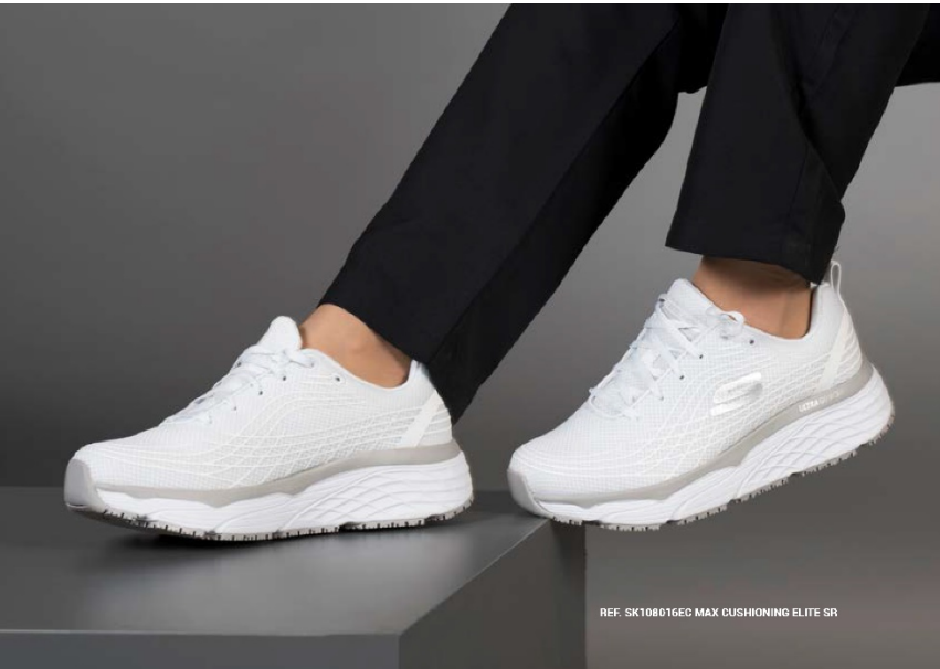
REF. SK108016EC MAX CUSHIONING ELITE SR