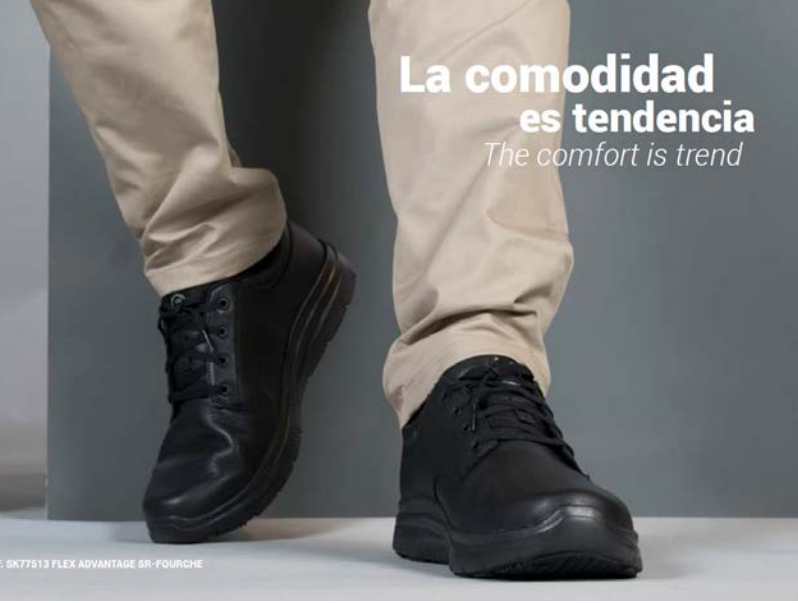
REF. SK77513 FLEX ADVANTAGE SR-FOURCHE