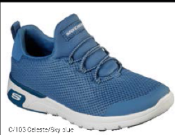
C/100 Celeste/Sky Blue