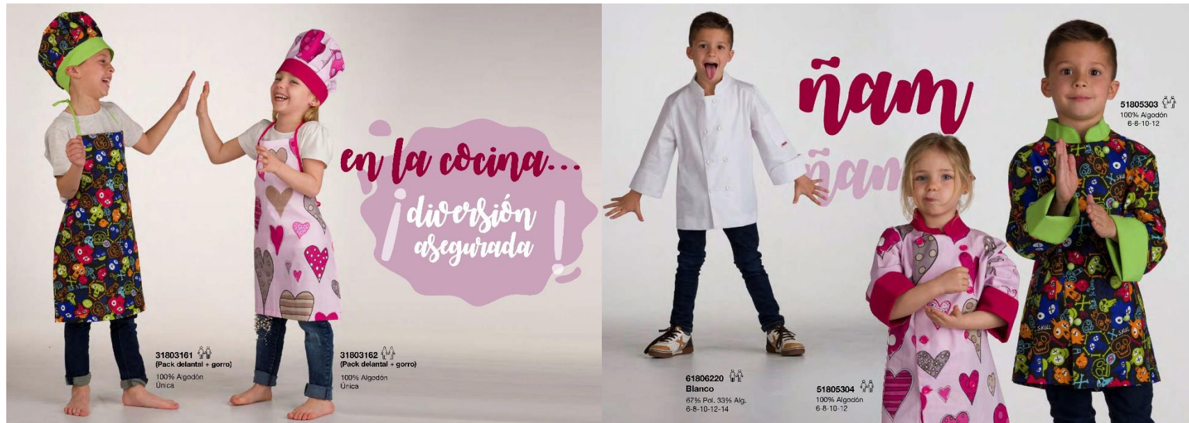
31803161 (Pack delantal + gorro) 100% Algodón Única