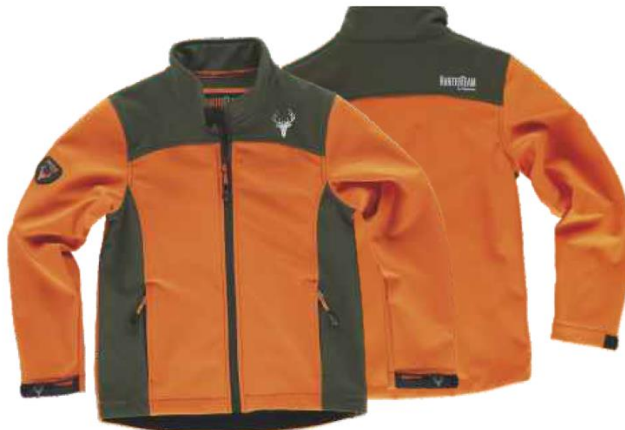
naranja a.v./verde caza

Tejido: 96% Poliéster 4% Elastano (300 g/m2)