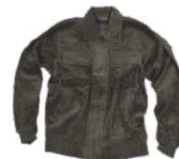
Verde Kaki Khaki Green