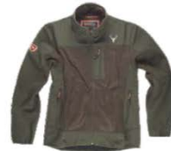
Verde caza Hunter green