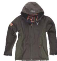
Marrón/Verde caza Brown/Hunter green