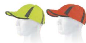
Amarillo A.V. H.V. Yellow

Gorra alta visibilidad. Ajuste trasero. Bandas reflectantes horizontales. High-visibility cap. Adjusts at the back. Horizontal reflective tapes.