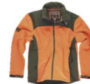
Naranja A.V./Verde Caza H.V. Orange/Hunter green