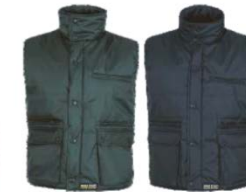
Verde botella Dark green Marino Navy