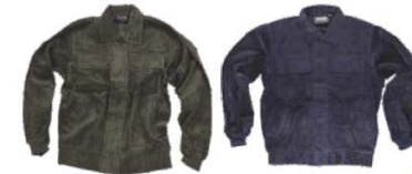
Verde Kaki Khaki Green Marino Navy