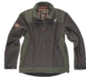
Marrón/Verde caza Brown/Hunter green