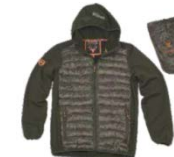
Verde caza/Camuflaje marrón Hunter green/Brown camouflage