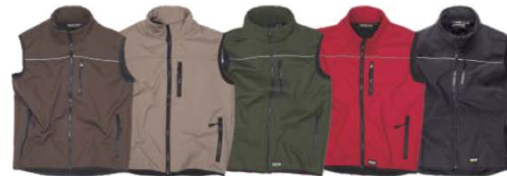
Marrón Brown Beige Beige Verde kaki Khaki green Rojo Red Negro Black