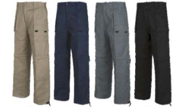
Beige Beige Marino Navy Gris Grey Negro Black