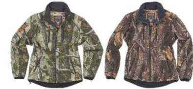
Camuflaje bosque verde Green forest camouflage