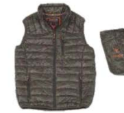
Camuflaje marrón Brown camouflage