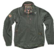
Verde Bosque Forest green