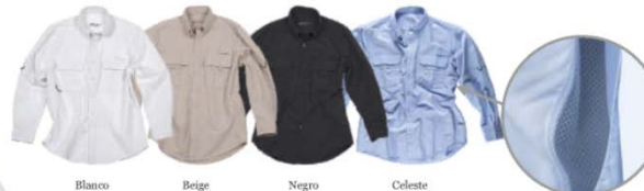
Blanco White Beige Beige Negro Black Celeste Sky Blue