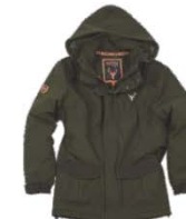
Verde caza/Marrón Hunter green/Brown