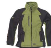
Verde kaki/Negro Khaki green/Black