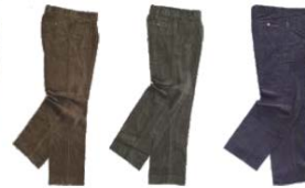
Beige Beige Verde Kaki Khaki Green Marino Navy