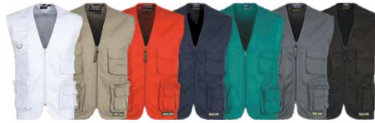
Blanco White | Beige Beige | Rojo Red | Marino Navy | Verde Green | Gris Grey | Negro Black