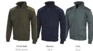
Verde kaki Khaki green