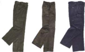
Verde Kaki Khaki Green Marrón Brown Marino Navy