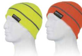
Amarillo A.V. H.V. Yellow

Gorro liso de punto con vuelta en el bajo. Alta visibilidad y una raya reflectante. Knit hat with round on the bottom. High-visibility and reflective band.