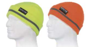
Amarillo A.V. H.V. Yellow

Gorra alta visibilidad. Ajuste trasero. Bandas reflectantes verticales. High-visibility cap. Adjusts at the back. Vertical reflective tapes.