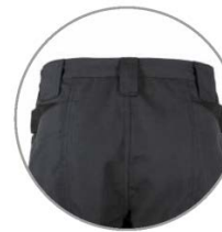
Detalle de la cintura Waist detail

Multipockets regular fit trousers. Elastic waist. Belt loops. Button fastener and zip fly. Reinforcement on knees. Front pockets and tool pocket. Inner side pockets with zip fastener. Back pockets with zip fastener and strap.