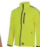
Amarillo A.V. H.V. Yellow