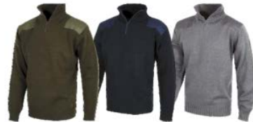
Verde Kaki Khaki Green Marino Navy Gris Grey