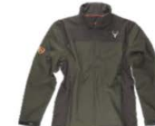
Verde caza/Marrón Hunter green/Brown