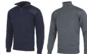
Marino Navy Gris Grey