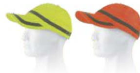
Amarillo A.V. H.V. Yellow