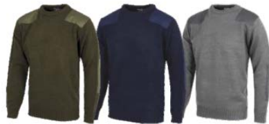
Verde Kaki Khaki Green Marino Navy Gris Grey